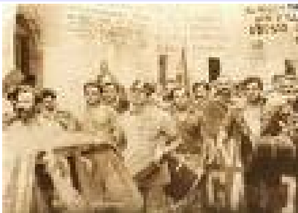
Prime proteste di piazza

Durante il 17° Congresso Socialista la corrente di estrema sinistra, guidata da Gramsci e Bordiga, abbandonò il Congresso fondando successivamente il Partito Comunista Italiano.